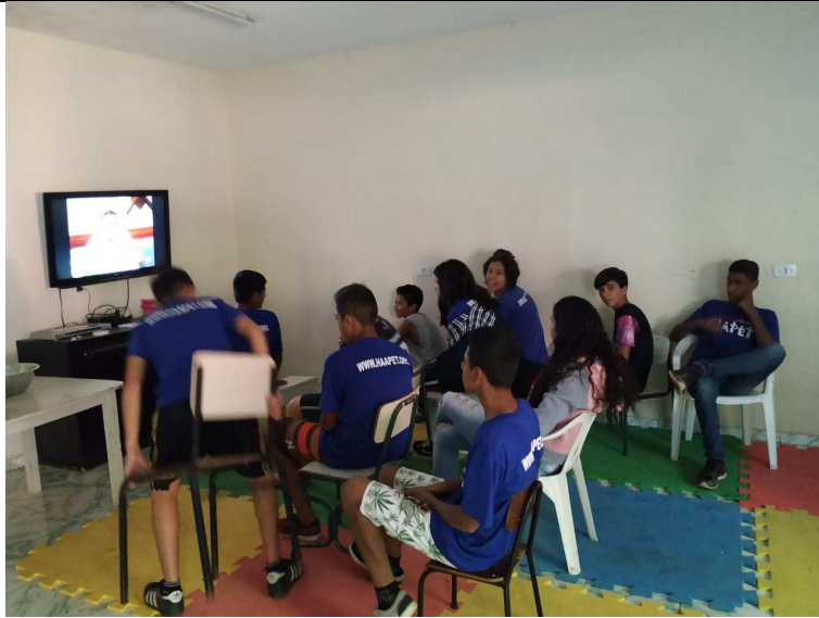
Atividade: Oficina de Lanche natural com crianças e adolescentes